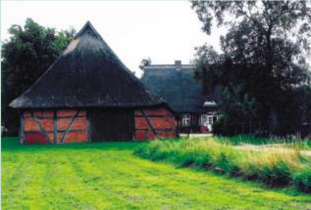
Die Pfarrscheune wurde 1745 errichtet.

Ungewöhnlich ist nicht nur das Ensemble des Pfarrhofes als reetgedeckter Dreiseitenhof, sondern auch seine abgeschiedene Lage. Einer eher ungewöhnlichen Legende nach, soll ein menschscheuer Pastor die Errichtung des Pfarrhauses einige hundert Meter vom Kirchhof entfernt erwirkt haben.